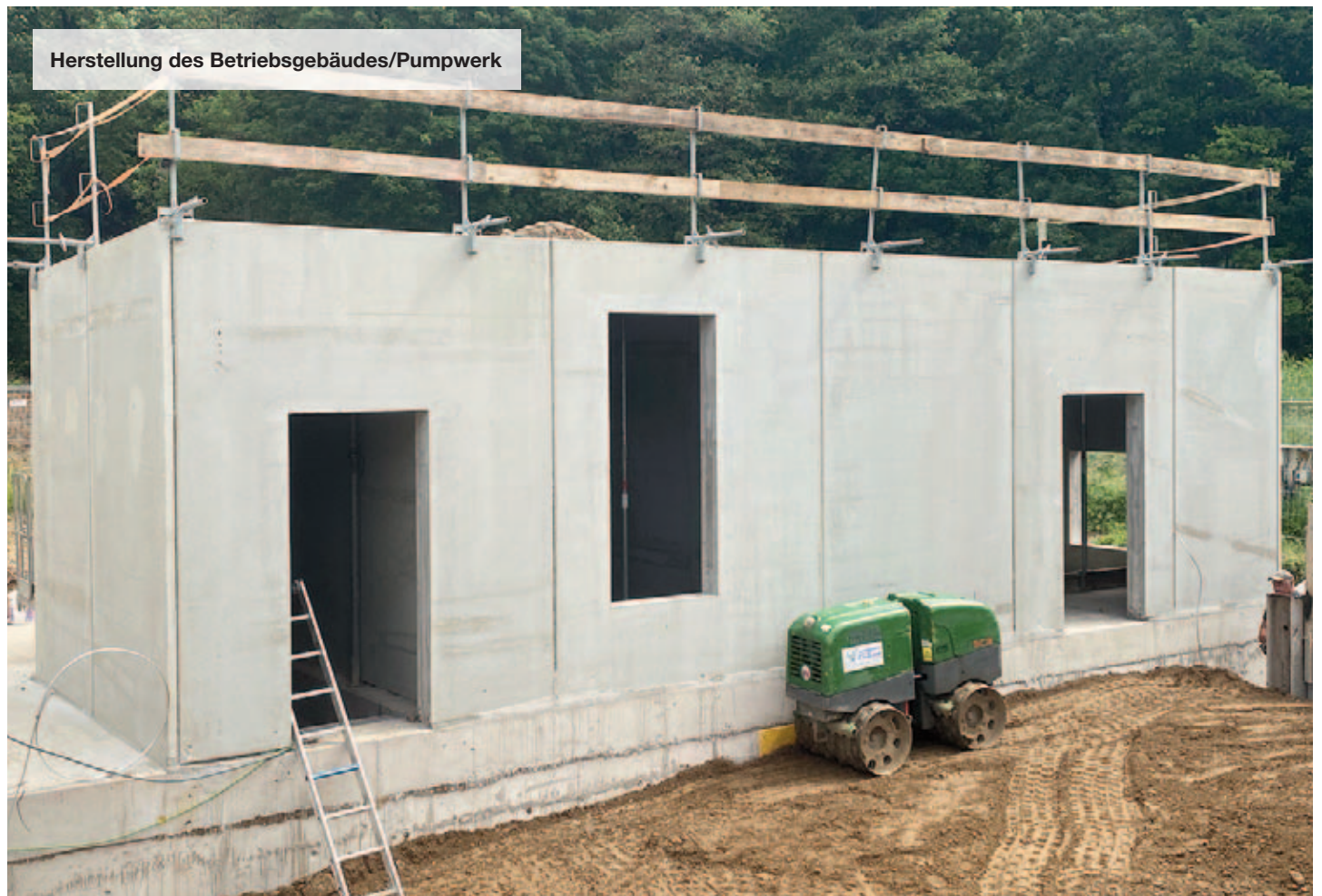
Herstellung des Betriebsgebäudes/Pumpwerk