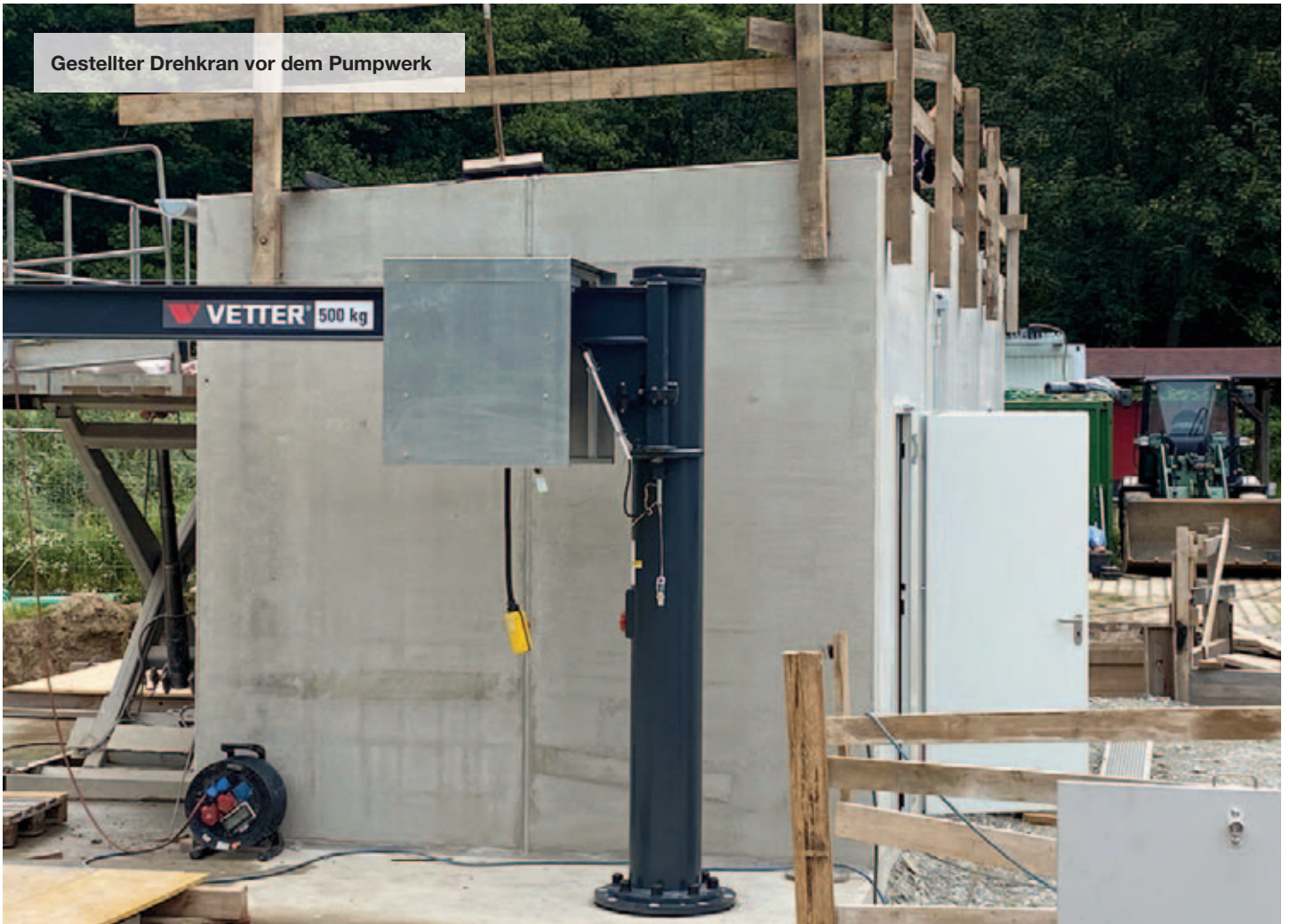
Gestellter Drehkran vor dem Pumpwerk